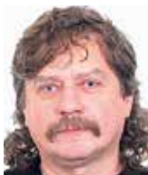
Jan Keller poslanec Evropského parlamentu za ČSSD

Jak by se vedení našeho státu mělo postavit k návrhu nařízení Dublin IV? A co dělat v případě jeho schválení?