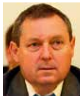
Jiří Maštálka poslanec Evropského parlamentu za KSČM

Tento či podobný postup jsou možné pouze za předpokladu, že to většina české politiky takto naléhavě cítí. Zatím to tak ale nevyplývá. Rozhodná a důvěryhodná stanoviska prozatím slyšet nejsou. Naše politika se nechává zmítat chaosem a nedůvěrou a mlátí prázdnou slámu o své „prozápadnosti“. Pak to ale bude s námi mít Brusel ještě jednodušší, než by vůbec mohl doufat. A zdá se, jako by to rozhodujícím českým politickým formacím ani moc nevadilo.